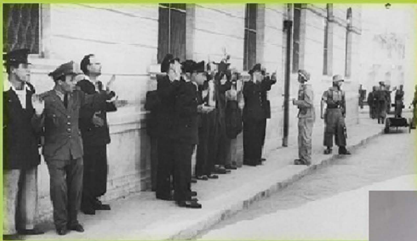
FUGLIA e LUGANIA